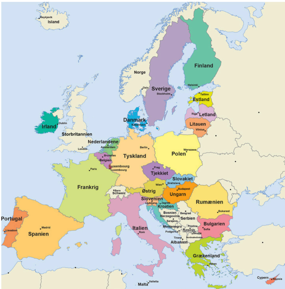
EU's 27 medlemsstater (fra 1. februar 2020)