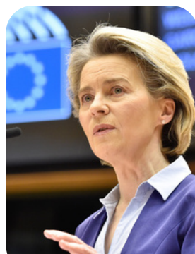
Ursula von der Leyen

Udover formanden består Kommissionen af én kommissær fra hvert medlemsland. De nomineres af deres lands regering, men de er uafhængige af medlemslandene. Endelig har de hver især ansvar for et eller flere politiske områder.