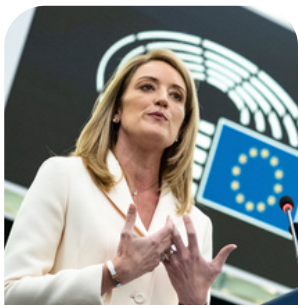
Roberta Metsola (EPP)

Sidst, men ikke mindst, spiller Parlamentet en afgørende rolle i at udnævne Kommissionen og fungerer som en demokratisk kontrol af EU's øvrige institutioner.